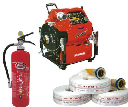
消防ホース・消火器等販売