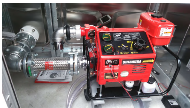
動力消防ポンプ設備